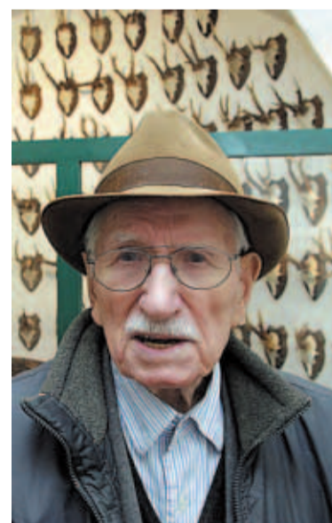
FRANZ-NORBERT PIONTEK / AP

La derrota de las potencias centrales llevó aparejada la desaparición de aquel conglomerado, que devino, con el tiempo, en trece estados independientes. Künstler